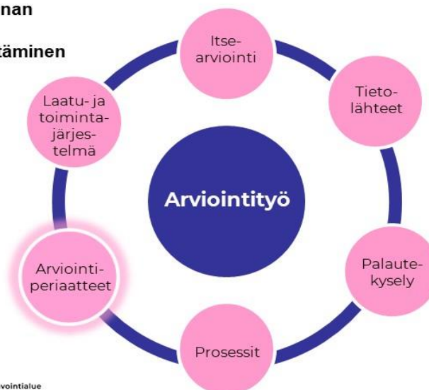
Kuvio 2. Tarkastuslautakunnan laadunhallinta ja arviointityön kehittäminen. 14

Tarkastuslautakunnan laadunhallinta ja arviointityön kehittäminen