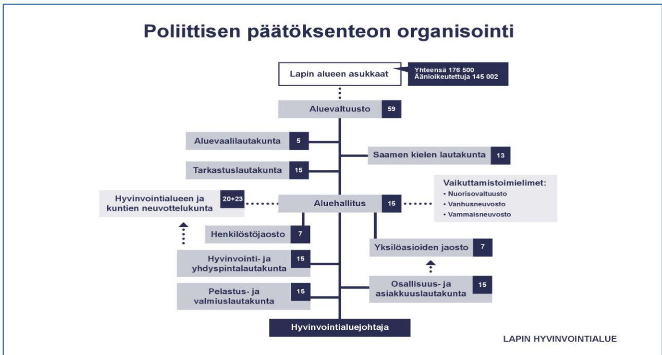
Kuvio 1. Luottamushenkilöorganisaatio.